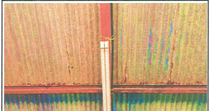
Foto 2: Cubiertas de Lamina, Sustitución de lamina por lamina troquelada Aluzinc calibre 26