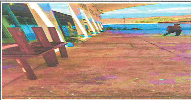
Foto 5: Canales y bajadas de agua pluvial, sustitución de canal de metal, reparación de bajada de agua pluvial, tuvo pbc 3 pulgadas y reparación de cunetas de concreto.