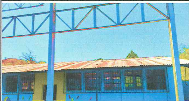
Foto1: Cubiertas de Lamina, Sustitución de lamina por lamina troquelada Aluzinc calibre 26