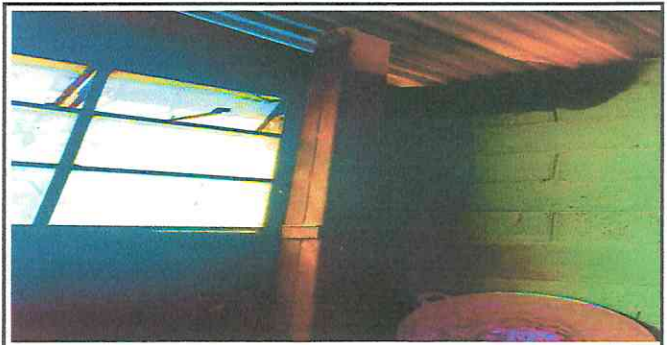
Foto 6: Reparación de cocina, mantenimiento a estufa rural, sustitución de chimenea de metal, instalación de azulejo en estufa rural y mesones de cocina.

Observación: Si es necesario se pueden agregar hojas adicionales y actualizar el número de hojas.