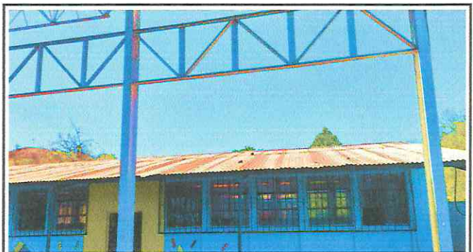
Foto 4: Canales y bajadas de agua pluvial, sustitución de canal de metal, reparación de bajada de agua pluvial, tuvo pbc 3 pulgadas y reparación de cunetas de concreto.